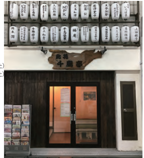
※劇場入り口の様子

そもそも関西には講談師はもちろん、演芸に携わる芸人や表現者が気軽に会を開催できる劇場が少なく、予算との兼ね合いで悩むことや諦めざるをえないことも多い現状です。そんな状況を少しでも改善すべく、講談を中心とした演芸や寄席などに気軽に足を運んでいただける場所、講談に関する情報発信の拠点となる場所を作るため、2019年1月にオープンいたしました。しかしながら、予定以上に設備費用がかさみ、現在も提灯を募集しております。皆様のご協力をお願いいたします。