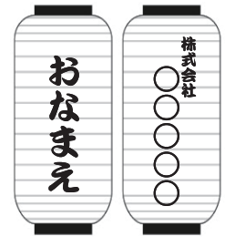
提灯(ちょうちん)設置例